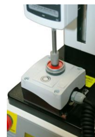
Masurare forta activare buton