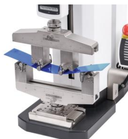
Testare indoire in 4 puncte