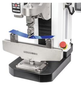
Testare indoire In 3 puncte