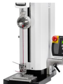
Testare terminale cabluri