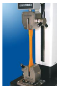
Masurare forta tractiune