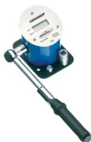
Calibrare chei dinamometrice