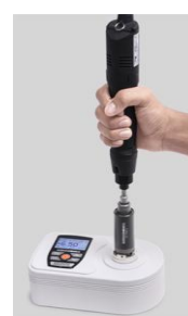
Calibrare surubelnite electrice