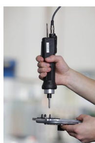
Strangeri cu surubelnite electrice