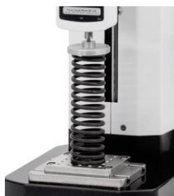
Masurare compresiune arcuri