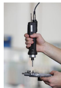
Strangeri cu surubelnite electrice