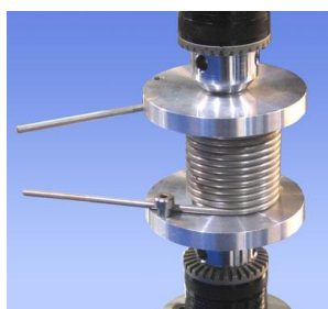
Masurare torsiune arcuri