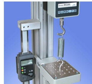
Masurare tractiune arcuri