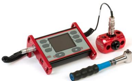
Calibrare chei dinamometrice