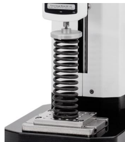
Masurare compresiune arcuri