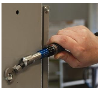
Strangeri controlate cu chei dinamometrice