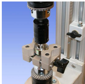
Masurare torsiune rulmenti