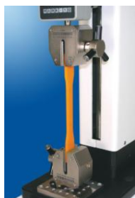
Diverse teste la tractiune