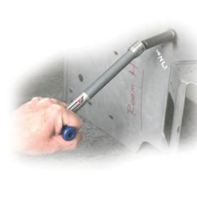
Testare suruburi sudate