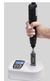
Calibrare surubelnite electrice